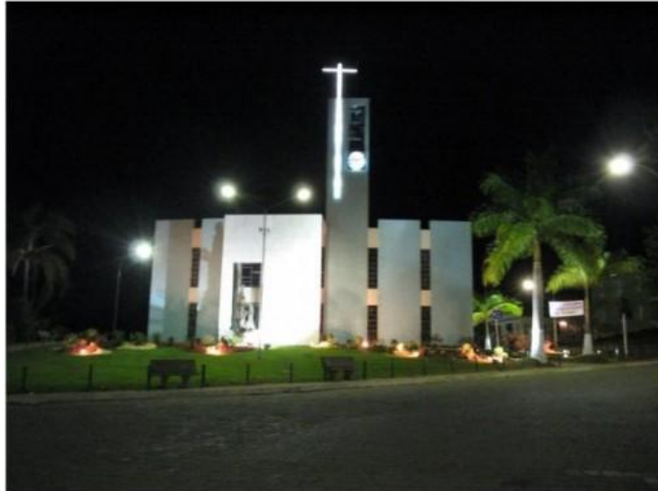
Nova Matriz de Santana, Ferros, MG.

Em Diamantina, o anseio das elites pela modernização do antigo Tijuco resultou no esforço de dotar a cidade de estrada de ferro, prédios neoclássicos, luz elétrica, teatro e cinema, calçamento e água encanada, hospício e asilo para velhos e incapazes. Todavia, uma das obras que melhor exteriorizaram a visão de “modernidade” das elites diamantinas, plasmada em cultura católica, foi a construção da nova Sé. A antiga Sé de santo Antônio, na Rua Direita, de origem setecentista, foi demolida e, no seu lugar, construída uma igreja muito maior, em estilo neocolonial (lembre-se que o modernista Lúcio Costa foi apegado ao neocolonial) para marcar a grandeza da Diocese e os novos tempos que a cidade vivia. Era hora de romper com o passado colonial, de Chicas da Silva, Joões Fernandes e Isidoros Mártires. Já o Seminário de Diamantina abraçou o neoclássico, enquanto sua basílica foi erguida no estilo neogótico.